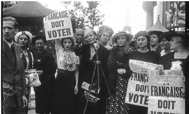
Paris, 1937. Extrémistes réclamant le droit de vote pour les Françaises.

rappeler à l'ordre par des gens qui ne sont pas des extrémistes.